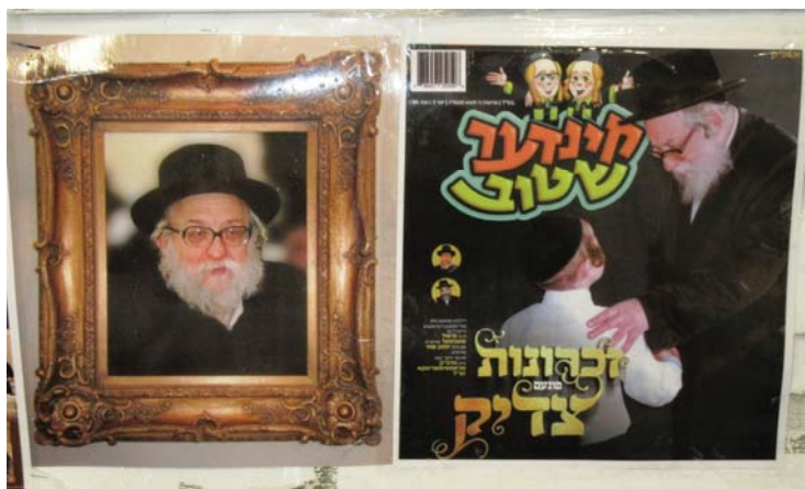
בתוך הסוכה של הרב שליט"א