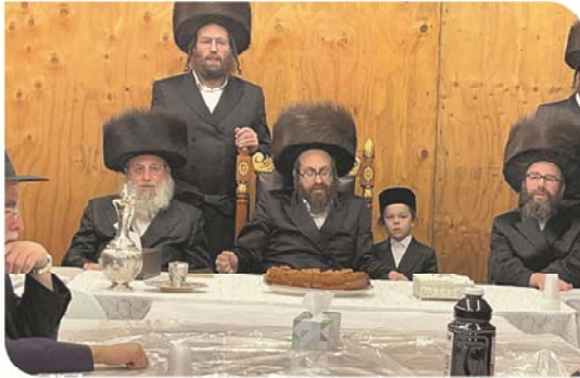
Rachmastrivka Rebbe of Lakewood Oak n Vine, shlita , Sukkos