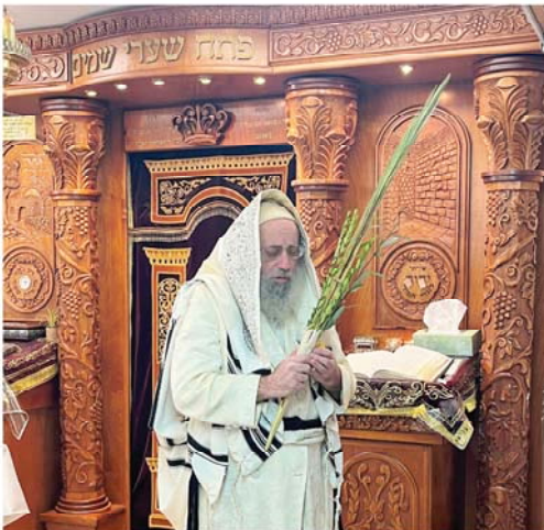
סוכות ביי הגה"צ אב"ד סאנטוב שליט"א